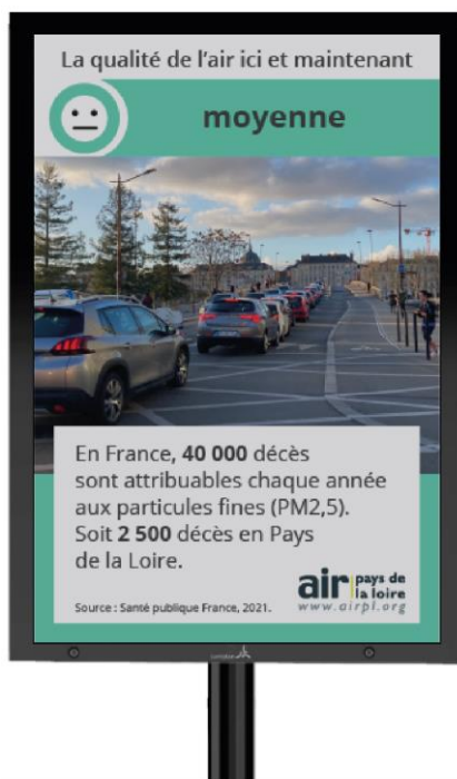
Panneau « automobilistes »

L'autre pour les cyclistes dans le sens nord-sud, indique la qualité de l'air sur trois itinéraires cyclables au départ du pont (boulevard Léon Bureau, Parc des Chantiers et quai François Mitterrand) et permet de se rendre compte des variations de la qualité de l'air en fonction des jours et des heures de la semaine et de faire un choix sur son trajet en fonction de cette information.